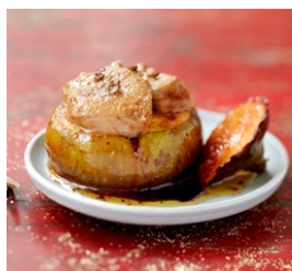
Figs farcies au Foie Gras du Sud-Ouest IGP