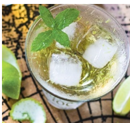
Cocktail au Floc de Gascogne blanc AOP