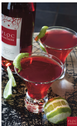
Cosmopolitan au Floc-de-Gascogne