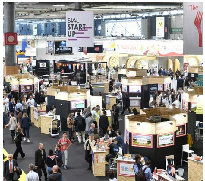
Village Start-up SIAL Paris 2022

Pendant 5 jours se sont succédées 120 visites officielles internationales , dont 3 ministres de la République française*, preuve que l'alimentation et la gastronomie sont des leviers de plus en plus importants de la communication des pays et plus généralement de leur diplomatie. Pour la première fois, l'Italie est le pays le plus représenté au SIAL avec plus de 800 exposants continuant de promouvoir une belle cuisine, savoureuse et facile à réaliser. On constate sur cette édition une fréquentation importante des pays européens et une présence très forte des acheteurs turcs, américains, coréens et brésiliens. La Corée du Sud est quant à elle un nouveau territoire d'expression gustative, avec 132 marques représentées au sein de son pavillon et mises en valeur par des chefs coréens et un chef français de renom, Eric Trochon. Elle décroche également un Grand Prix SIAL Innovation dans la catégorie Épicerie salée pour la version lyophilisée d'un plat emblématique de son patrimoine gastronomique: le kimchi.