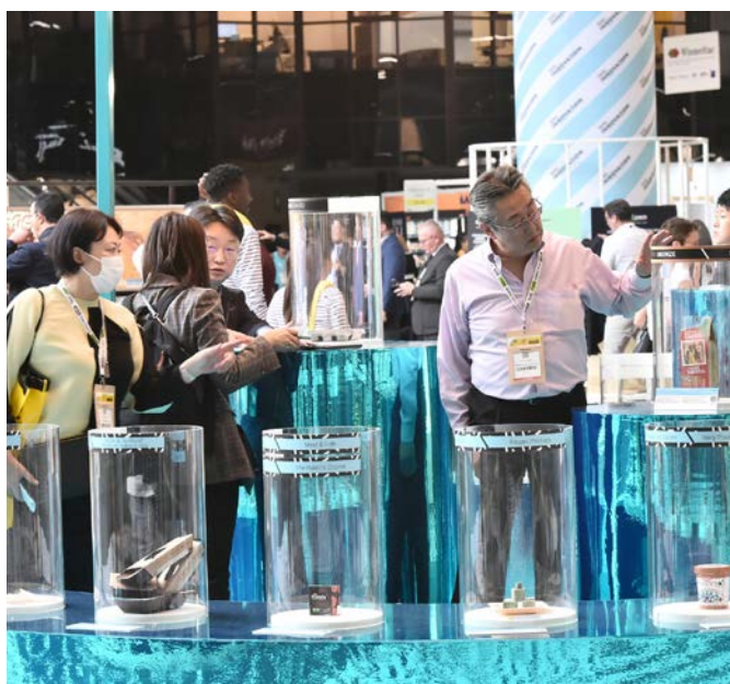
Produits lauréats exposés sur l'espace SIAL Innovation 2022

Le SIAL ne pouvait avoir meilleure thématique que celle d'« OWN THE CHANGE », mettant en avant ce que tous les maillons de la chaîne mettent en place avec engagement pour innover, produire, distribuer, consommer de manière plus vertueuse. Une manière pour le SIAL de rendre compte des scénarios du futur pour les aider à anticiper ce que sera demain tant au niveau des nouveaux ingrédients que des technologies et des attentes des consommateurs, en termes de santé, d'authenticité, de transparence et de bien manger.