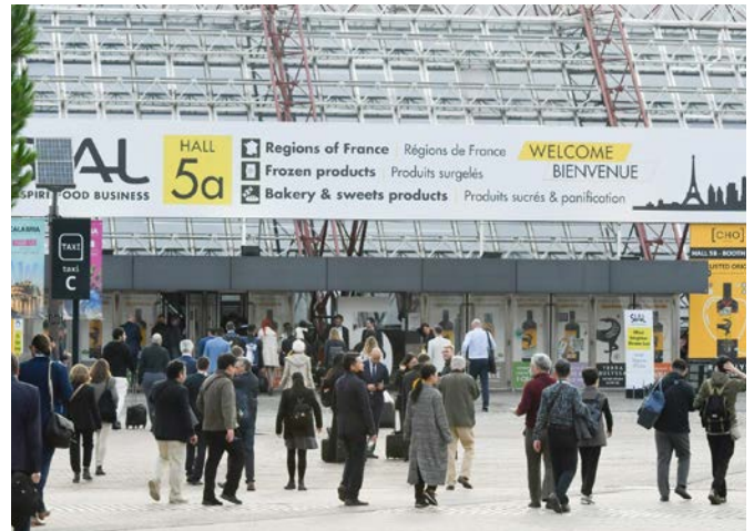
SIAL Paris 2022 vue extérieure

Audrey Ashworth , Directrice de SIAL Paris