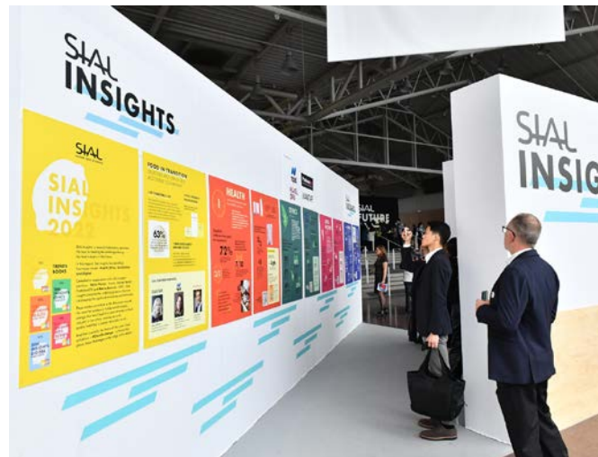
Restitution de SIAL Insights sur les tendances qui agitent la planète food

Venue repérer avec son équipe des produits à la fois pour le grand public et pour les chefs, elle a dès le premier jour signé des accords avec 8 nouveaux fournisseurs notamment dans l'épicerie fine. Ce n'est ni son premier SIAL ni son dernier car elle compte bien revenir en 2024 avec une équipe encore plus nombreuse.