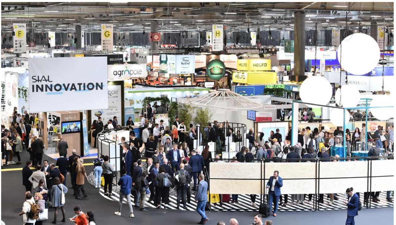
Vue générale salon SIAL Paris 2022

SIAL Paris vient de fermer ses portes. Le bilan est extrêmement positif : c'est le premier événement mondial de cette envergure qui réussit à retrouver son niveau prépandémie , tant côté exposants que visiteurs. En effet, le salon a réuni plus de 7 000 exposants de 127 pays (90% internationaux) avec une fréquentation quasiment équivalente à l'édition 2018 soit 265 000 professionnels et une proportion de visiteurs internationaux encore plus spectaculaire (85%) dont 50% d'importateurs/exportateurs et 8 000 top acheteurs pesant à eux seuls un portefeuille d'achat de plus de 50 milliards d'euros. Le salon a tenu toutes ses promesses de reconnexion des acteurs du secteur et renforce son positionnement de rendez-vous business incontournable du secteur agroalimentaire mondial .